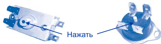
Рис. 3 Схема расположения кнопки термовыключателя

Вышеперечисленные неисправности не являются дефектами ЭВН и устраняются потребителем самостоятельно или за его счет.